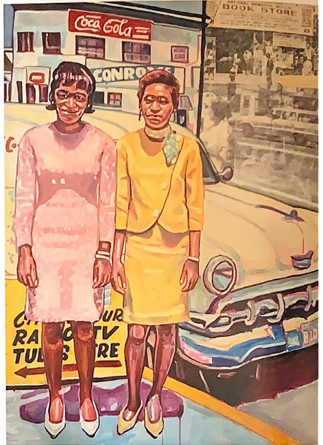
What they did yesterday afternoon (2019)