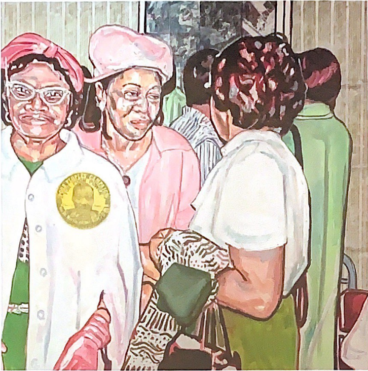
You can fool some people sometimes, but you can't fool all the people all the time (2019)